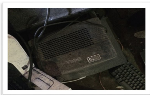
Imagen 6, Monitor con la Etiqueta de Activo