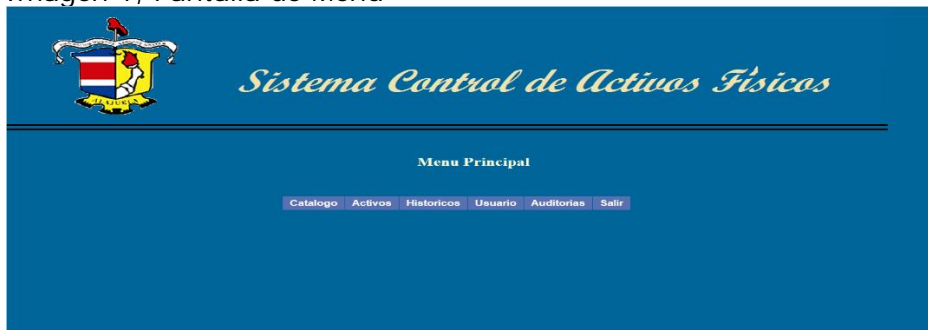
Fuente Sistema de Control de Activos

De acuerdo con el análisis efectuado y las pruebas correspondientes, el Sistema de Control de Activos presenta una serie de debilidades, que a criterio de este Despacho, la Administración debe gestionarlas, toda vez que se consideran claves para el fortalecimiento de los procedimientos en cuanto al manejo de activos y del control interno.