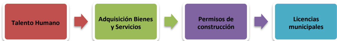
Imagen 3. Eje 2 Gestión de riesgos de corrupción, tomado de la herramienta proporcionada por la Contraloría General (2022)

En este eje se evaluó la valoración de riesgos de corrupción como parte del Sistema de Control Interno, específicamente en las siguientes áreas: