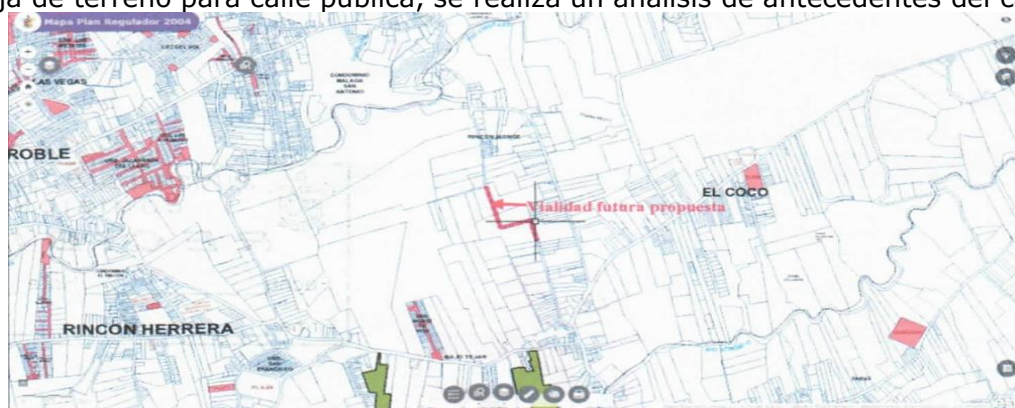
Figura 1. Ubicación de la franja de terreno a donar, fincas 2-074249-001 y 002; 2146710A-000 y 2-579922-000 ubicadas en El coco, Guácima.

En atención al oficio de referencia, mediante el cual solicita referirse a lo expresado en el oficio del Subproceso Gestión Vial N o MA-SGV-957-2021, sobre una intención de donación de una franja de terreno para calle pública, se realiza un análisis de antecedentes del caso.