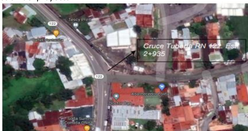
Imagen No. 1. Sitio de construcción del proyecto. Estacionamiento: 2+935